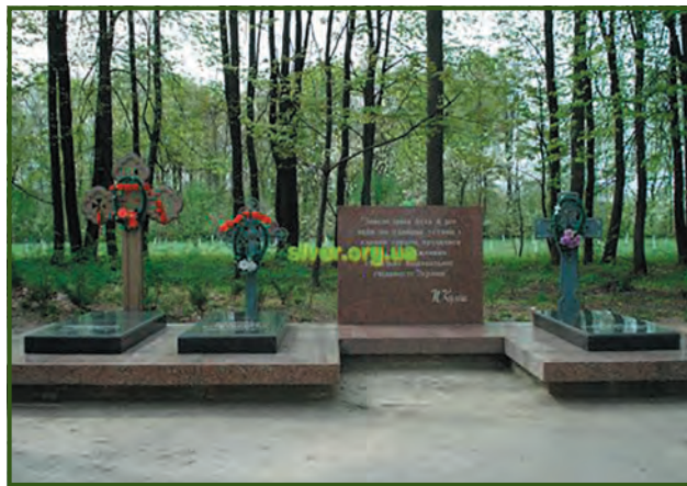
Хутір Мотронівка. Могили Пантелеймона Куліша, Ганни Барвінок і Василя Білозерського

У довіднику за 1896 рік знаходимо вже двох Білозерських — братів Миколу Васильовича і Тараса Васильовича. Микола був названий на честь Миколи Івановича Костомарова, який став його хрещеним батьком, а хрещеною матір'ю обрана Олександра Білозерська-Куліш (сестра Василя Михайловича). Микола скінчив Лісотехнічну академію в Санкт-Петербурзі, мешкав на Василівському острові, 10 лінія, 5. Колезький асесор Микола Васильович Білозерський працював на скромній чиновницькій посаді в 7 відділенні лісового департаменту Міністерства землеробства та державних маєтностей. А ще він захоплювався збиранням античних, виключно грецьких, монет. Обирався дійсним членом Імператорського археологічного інституту в Петербурзі.