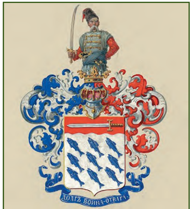
Герб роду Білозерських

За рік до своєї смерті, 16 березня 1860 року, Тарас Шевченко отримав у Петербурзі лист від свого приятеля, що жив там же, Василя Білозерського. У Василя щойно народився син, і щасливий батько прагнув поділитися радістю: «Поспішаю, дорогий наш Кобзарю, Тарасе Григоровичу, з вісткою: сьогодні ранком, у пів-четвертій годині дав нам Бог сина. Маємо надію,