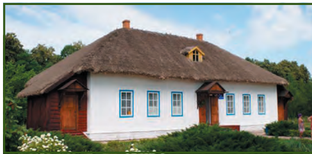
Хутір Мотронівка на Чернігівщині. Історико-меморіальний музей-заповідник «Ганнина пустинь». Тут жив Пантелеймон Куліш із дружиною Ганною Барвінок