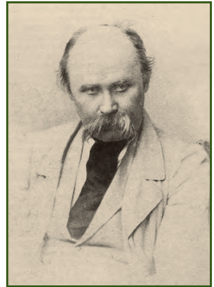
Тарас Шевченко. Фото 1860 року