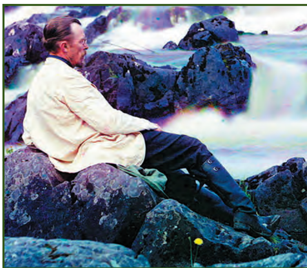
Фотограф Сергій Прокудін-Горський