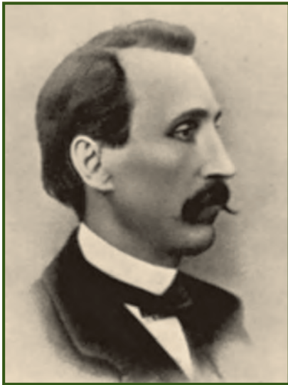
Письменник Пантелеймон Олександрович Куліш, дядько Тараса Білозерського