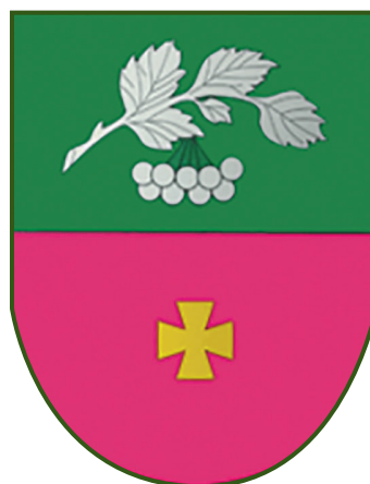
Герб села Маломихайлівка