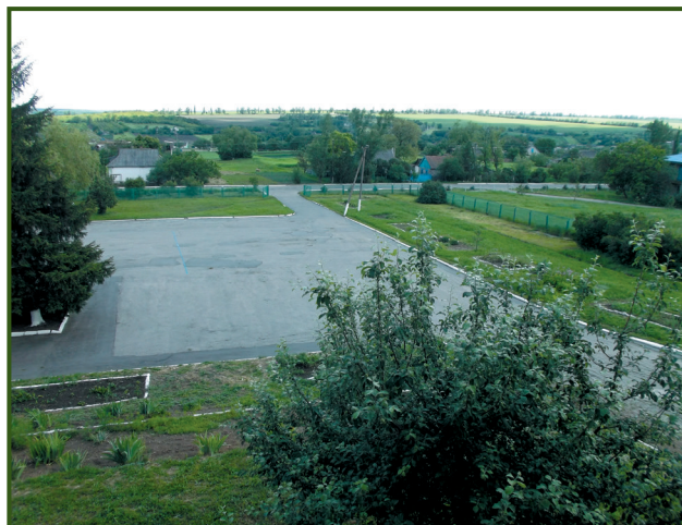
Сучасний гаврилівський краєвид