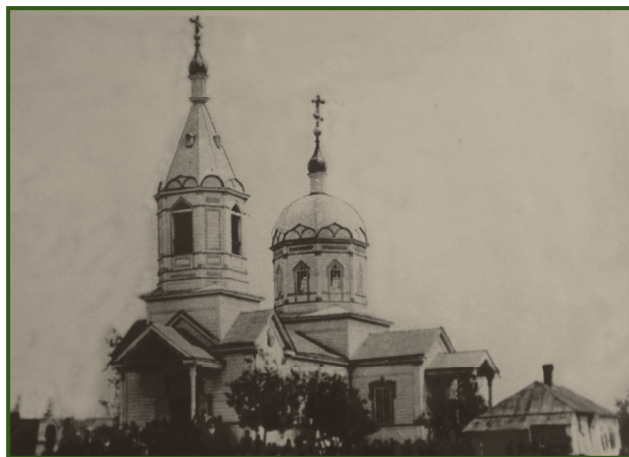
Село Гаврилівка. Кам'яна церква, зруйнована в 1933 році