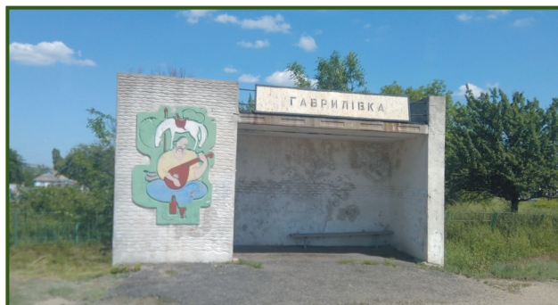
Козацьке минуле нагадує про себе на автобусній зупинці «Гаврилівка»

Тому 22 вересня 1911 року Олександрівське повітове земське зібрання ухвалило рішення відкрити в повіті три нові лікарняні дільниці, у тому числі в багатолюдній Гаврилівці. Як водиться, готували документи.